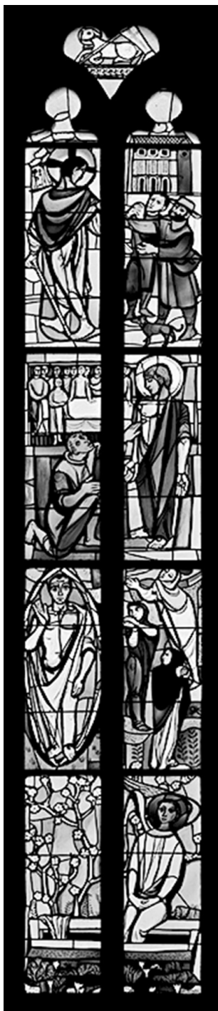
Uskrsnuće, Felix Hoffmann