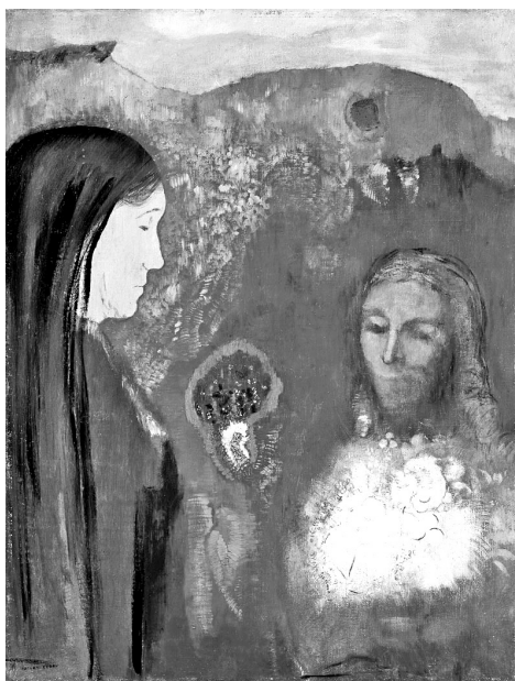
Samaritanian Woman , Odilon Redon