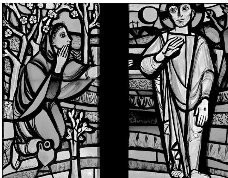
Uskrsnuće, Felix Hoffmann